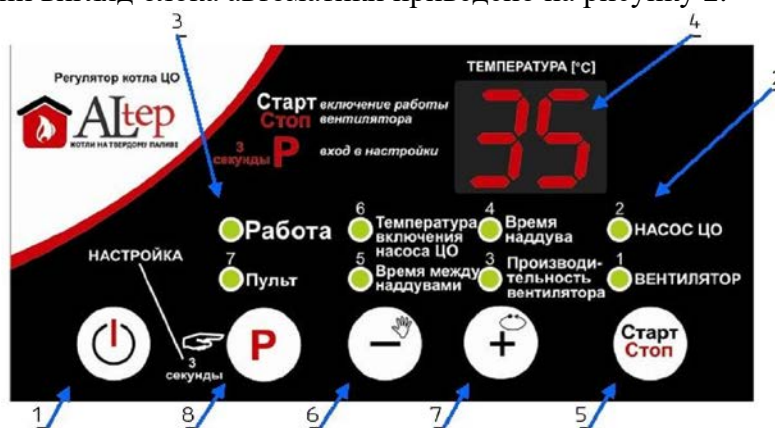
Рисунок 2 – Зовнішній вигляд передньої панелі контролера

6.2 Зовнішній вигляд блока автоматики приведено на рисунку 2.